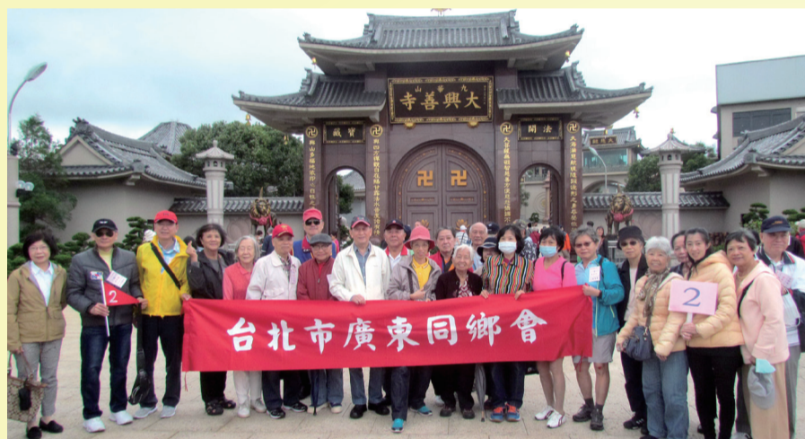
理事長與鄉親合影