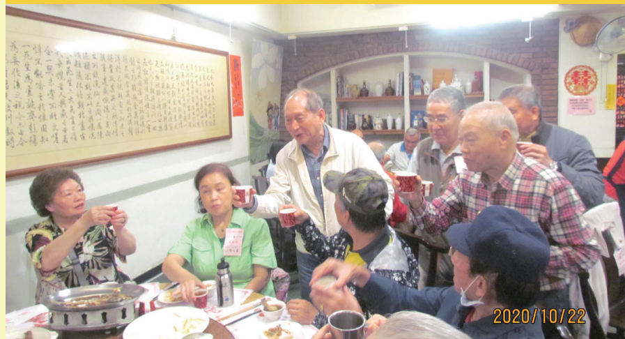
午餐理事長逐桌敬酒致意