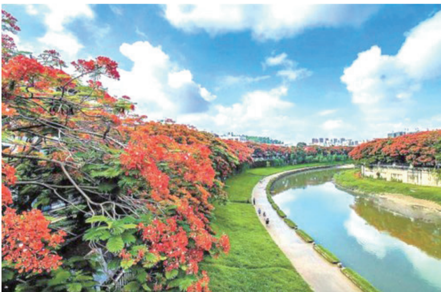
深圳「天藍水清岸綠花紅」，可作為台北美化河堤參考。