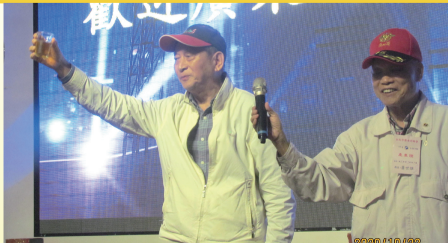
晚餐理事長致詞舉杯敬酒致意