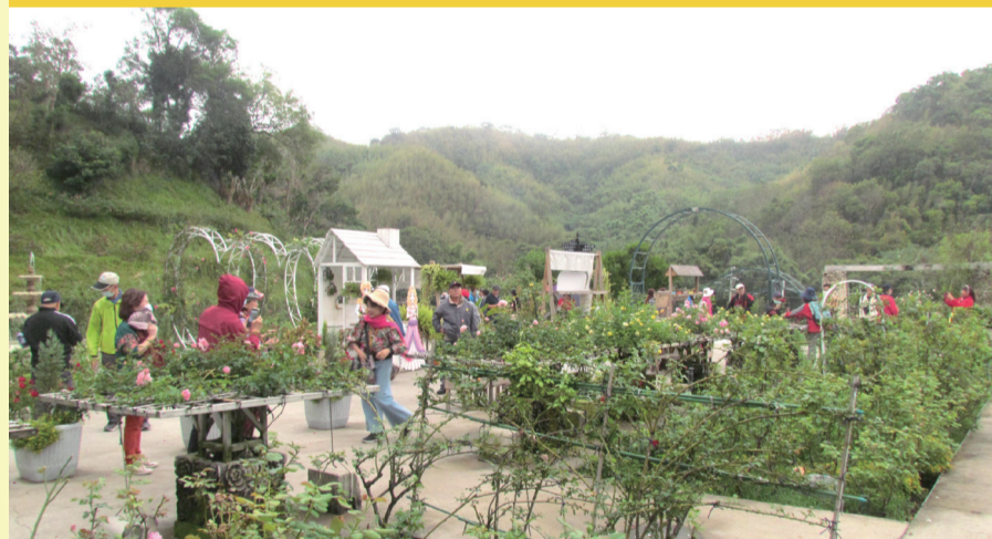
雅聞七里香玫瑰花園