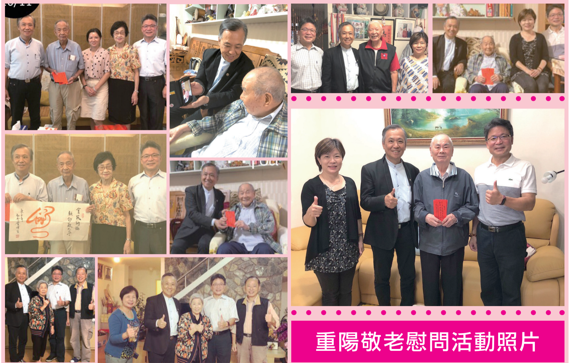
重陽敬老慰問活動照片

我們除了應持續發揮廣東先聖先賢，前輩勤勞儉樸精神和敬老尊賢的傳統美德之外，傳承給我們的下一代，更應讓年輕下一代的廣東子弟參與我們的各項活動。這是我們同鄉會當前刻不容緩的工作重點，期待我們各位鄉長一起努力達成。（台灣河源協會秘書長邢秀珍供稿）